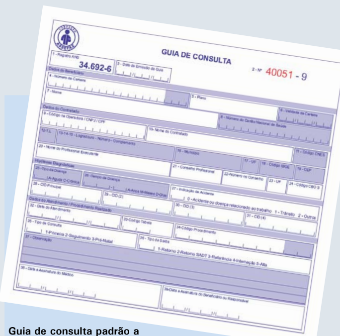
Guia de consulta padrão a todas as operadoras. Muda apenas a logomarca de cada empresa.

Embora a mudança interfira mais na atividade dos prestadores de serviço e da própria Assefaz, os pacientes devem também ficar atentos. “Com exceção da guia de solicitação de internação,